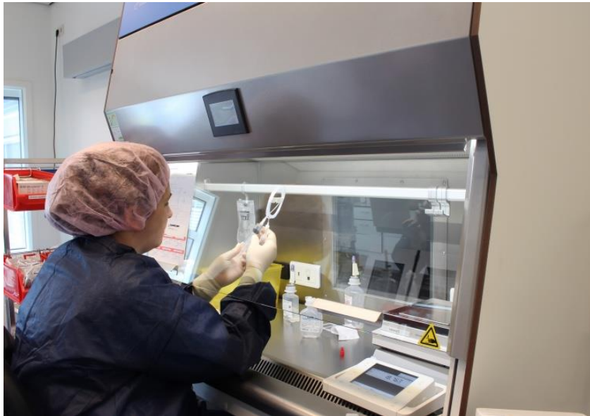
Regeling ggo: Hoofdstuk 2 en Bijlage 1 en 9